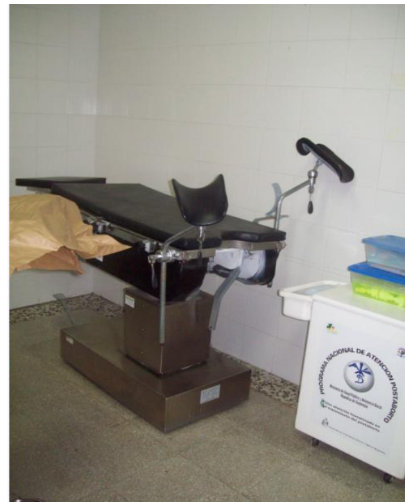
Equipo para la atención de partos