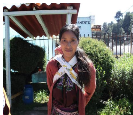
Entrevista con una de las usuarias del CAP