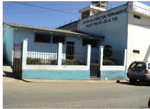
CAP de Palestina de los Altos