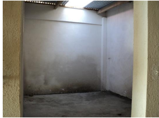
Habitaciones que no han sido utilizadas y se están deteriorando